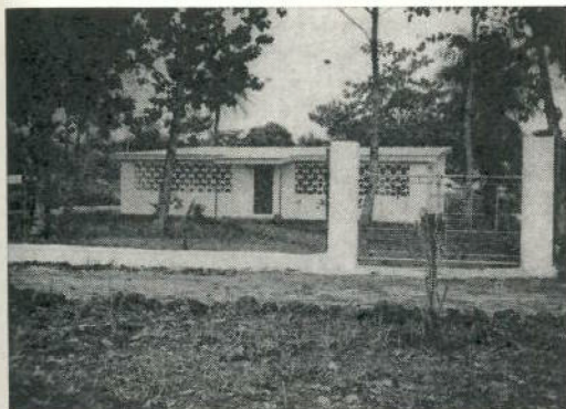
Residencia de enfermeras

Consta de un cuerpo rectangular, de una sola planta, cuya división central da lugar a la formación de dos apartamentos, cada uno de los cuales está formado por una galería exterior, comedor, dormitorio, cocina y cuarto de aseo, todo debidamente amueblado. La