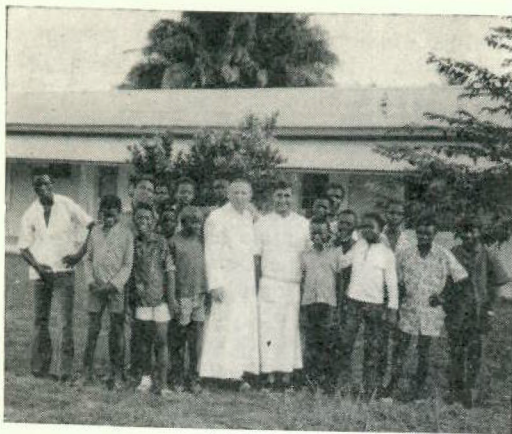
Hermanos con un grupo de niños africanos

para ubicar en nuestros terrenos las viviendas dedicadas a sus empleados. Entre ellas figura el asfalto de las entradas que dan acceso al hospital por la nueva carretera y la nivelación de gran parte de la finca. Nos han dejado asimismo la instalación completa de agua, con los dos grandes pozos hechos por ellos, de hormigón con su correspondientes bombas sumergibles, y un gran depósito de hierro para dar presión al agua, instalado por ellos.