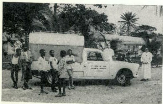
Ambulancia San Juan de Dios al servicio de los enfermos

En el mismo lugar en que se encontraba la antigua capilla, uniendo a ésta la habitación